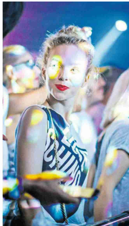
Peter Evans in Willisau 2017, Sol Gabetta in Gstaad 2017 und eine Zuschauerin in Montreux.