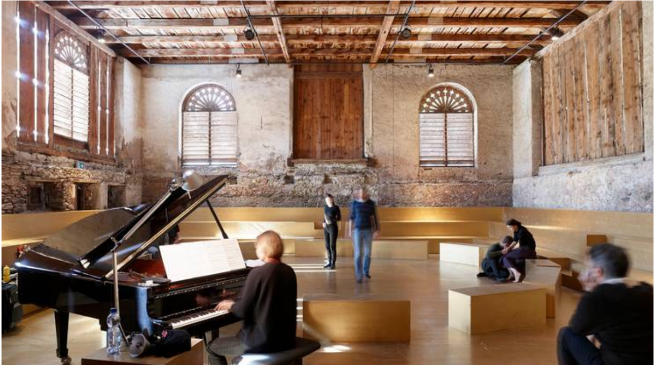
Da stalla a palcoscenico (keystone)